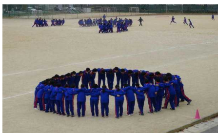
各クラスで自然と円陣を組んで

◎11/7(木)⑥⑦限に親睦をさらに深める目的で、学年レクリエーションを実施しました。天候にも恵まれ、HR運営委員や先生方の協力のもと、楽しいひとときが過ごせたと思います。