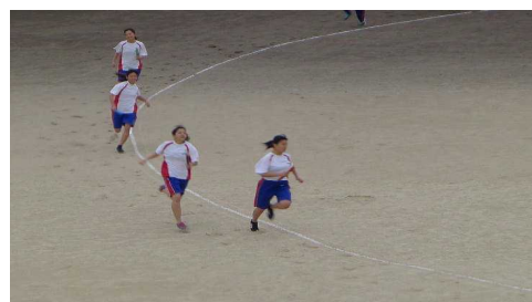
クラス代表によるリレーも接戦