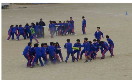
懸命に棒を引き合い