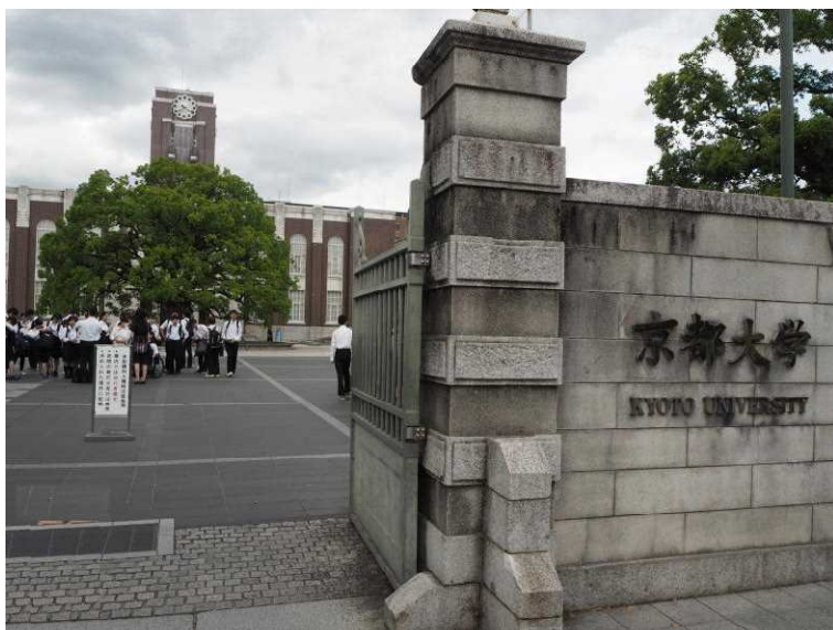
講義後の大学構内散策