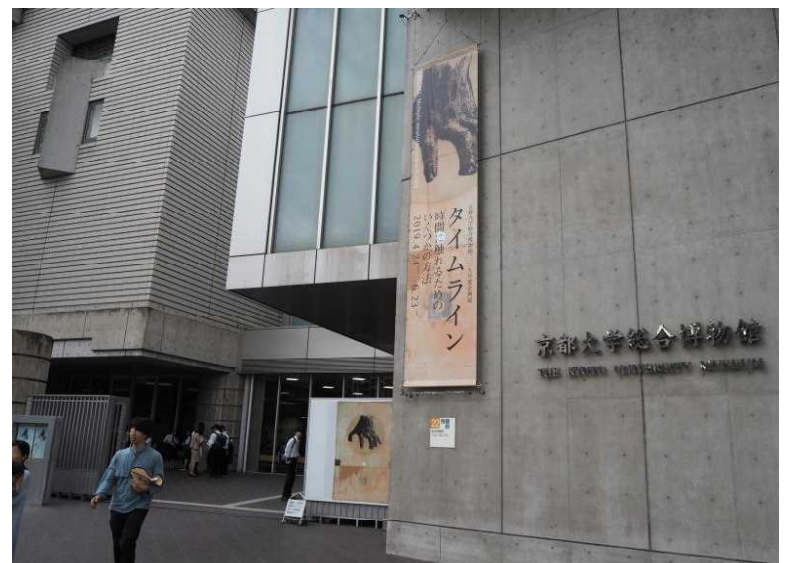
総合博物館の見学が人気でした