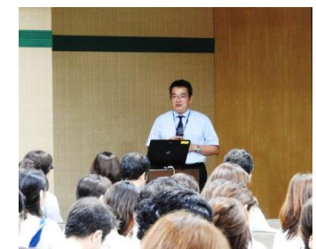
河合塾國光氏の講演