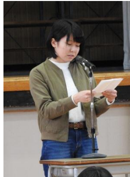
進路室には毎日通った