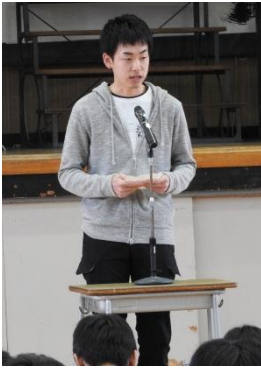
塾より学校の授業

3月21日の4限、今春の卒業生7名を招き、「卒業生からのメッセージ」を開催しました。自分なりの勉強方法を見つけた人、苦手科目を克服した人、E判定にへこたれることなく努力を続けた人、先輩たちの言葉は在校生の胸に刻まれたことでしょう。