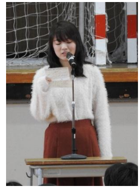
センターは過去問を 何度も！何度も！