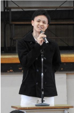
授業で寝て40点の失点