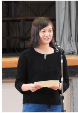
努力は裏切らない