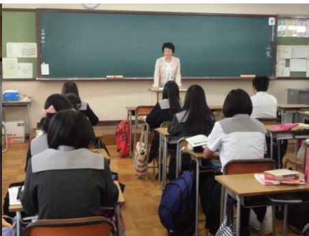
保育・幼児教育学